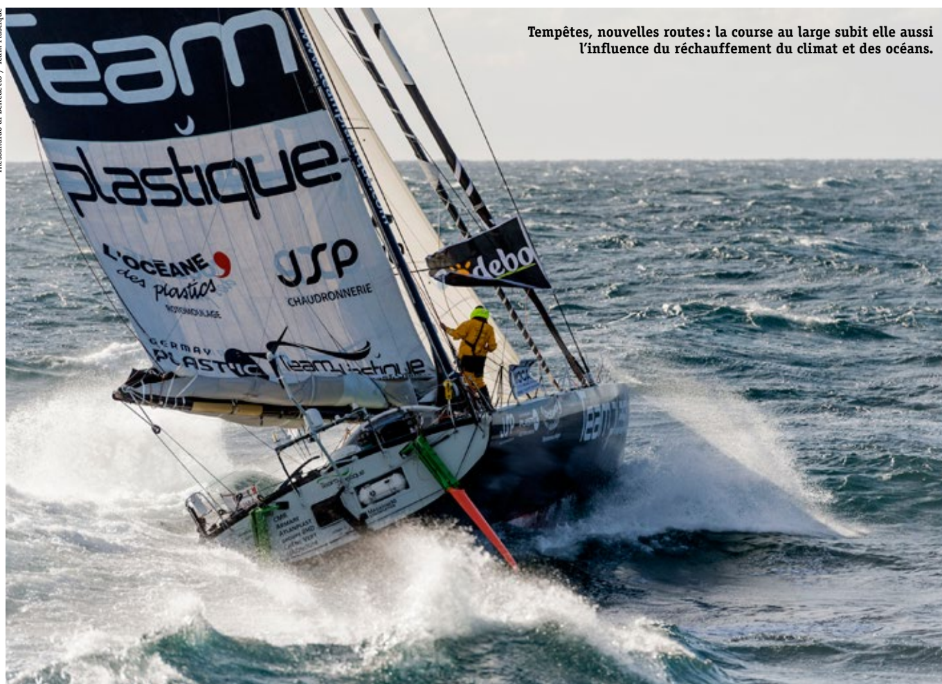
Tempêtes, nouvelles routes: la course au large subit elle aussi l'influence du réchauffement du climat et des océans.

Alessandro di Benedetto / Team Plastique