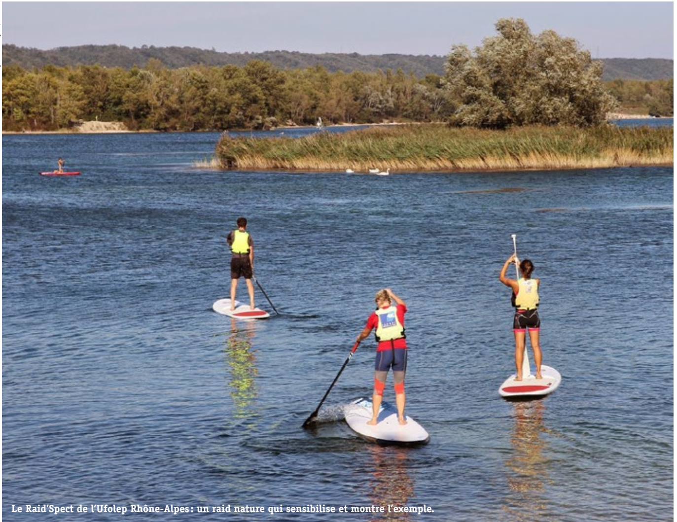
Le Raid'Spect de l'Ufolep Rhône-Alpes : un raid nature qui sensibilise et montre l'exemple.